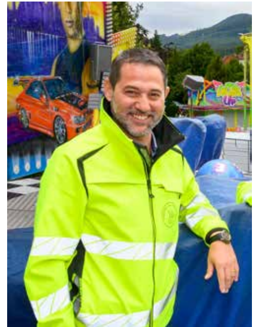
Wir sind sehr zufrieden»: Der Oltner Chilbichef zieht eine positive Bilanz

Für das nächste Jahr wolle man deshalb noch gezielter informieren und besser kennzeichnen. Denn eines ist klar: Die nachhaltige Lösung soll beibehalten, aber auch besser verstanden werden.